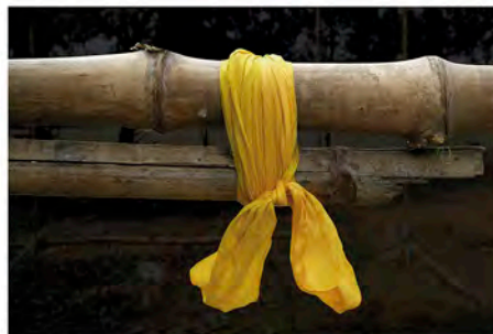
JUST A LINK