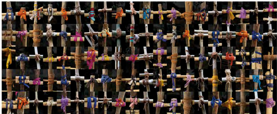
100 INDIAN LINKS

In the exhibition, the images from Unfinished Landscape are divided into three sections: «I. THROUGH TIME», «II. FROM THE IDEA TO THE FORM», «III. FROM THE FORM TO THE IDEA» and the complement of a documentary projection with the title «CONTAINERS OF A FLUID SPACE». In those radiant images, India builds itself and it rises. Miguel Ángel García's transurban investigation is one of the most profound records, in the realm of the visual image, of this world of changes we live in today. Let's go there. Let's travel with him and his images. In time. And in space. Of vision.